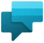
Power Virtual Agents

Mit Power Virtual Agents lassen sich ohne großen Aufwand Chatbots entwickeln, die das Chatten mit Ihren Kundinnen und Kunden sowie Mitarbeiterinnen und Mitarbeitern ermöglichen.